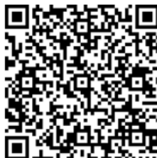
1 Stunde/2 Personen